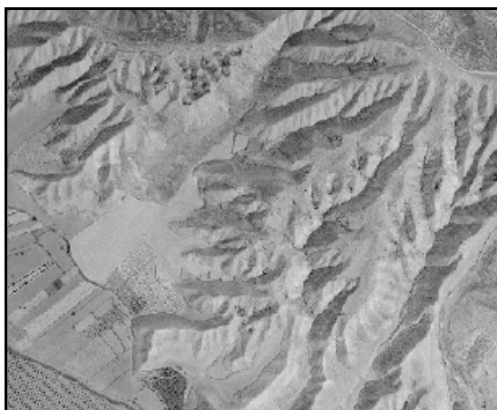
Zonas áridas erosionadas