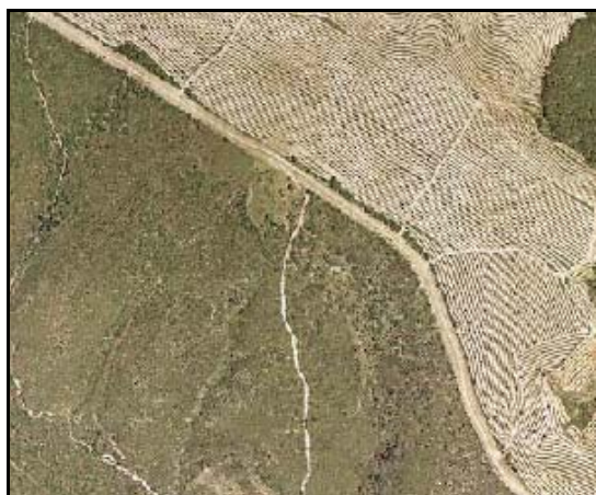
Roturados no agrícolas